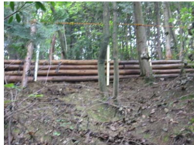
きれいに整備されました