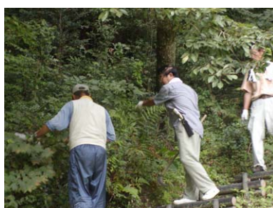
森づくり活動ようす