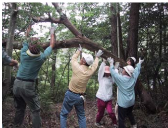
女性の活躍が目立ちました

保育園の保護者と松寿会の方が中心となって、園児や老人も安心して入れる森になるよう整備を始めました。