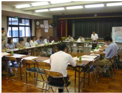
市之倉森づくり部会のようす

部会のメンバーは、市之倉まちづくり実行委員会、市之倉小学校、PTA、市之倉保育園と保護者会、松寿会（老人会）、エコクラブ…などです。