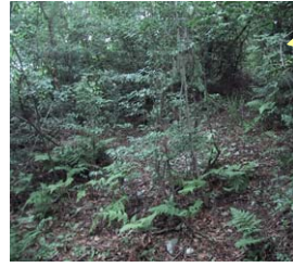
明るい森になりました