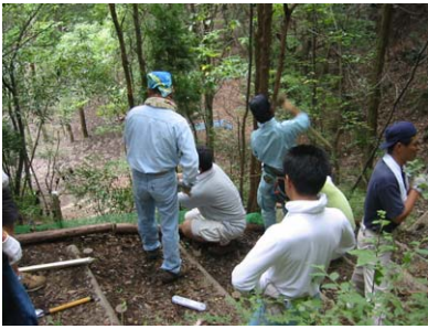
歩道の整備のようす

市之倉小学校 PTA のみなさんが中心となって、児童が安心して遊べるように、枯死木の伐採や歩道の整備をおこないました。