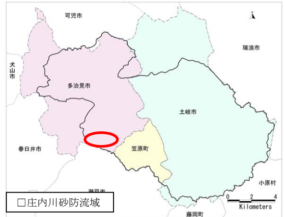
市之倉地区の位置