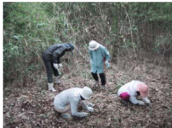
足をひっかけないように切株も処理します