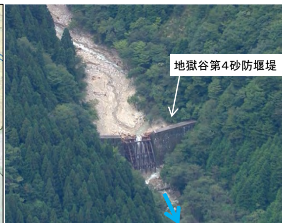
地獄谷第4砂防堰堤における流木捕捉状況