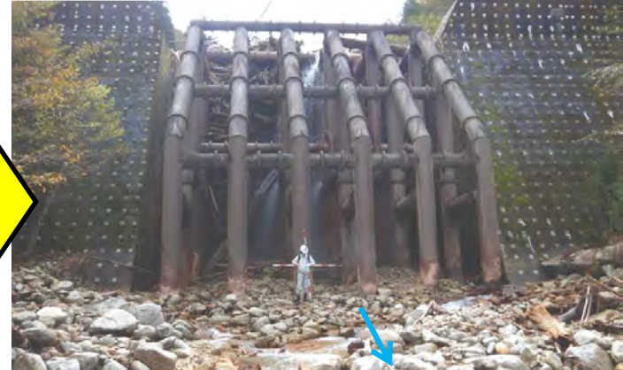
8月出水前の状況 (令和3年6月2日)