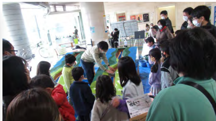
模型実験は、午前・午後3回ずつ、合計6回行い、大勢の方に見ていただきました。