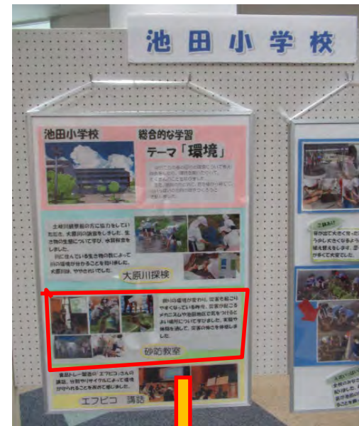
砂防教室が紹介されていました。