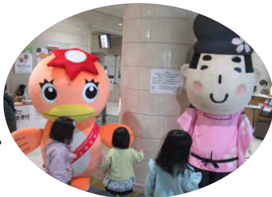
多治見市のゆるキャラ「うながっぱ」と春日井市からゲスト参加の「道風くん」。ちいさなお子さんに大人気でした。