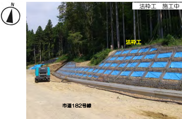
① R2.上切地区道路建設工事

市道東濃用水道3号線の通行止めをさせていただきます、門型函渠工(土留・仮締切工)を施工しています。引き続き工事のご協力をお願いします。