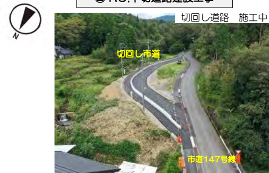
② R3.中切道路建設工事

武並町147号線の切回し道路を施工しています。引き続き工事のご協力をお願いいたします。