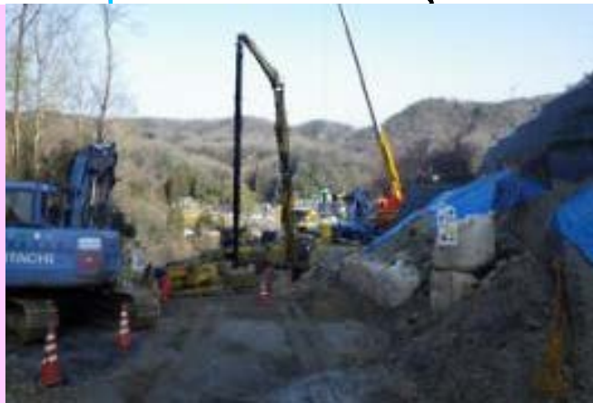
① 土岐側から見た施工状況