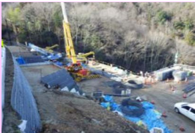
② 御嵩側から見た施工状況