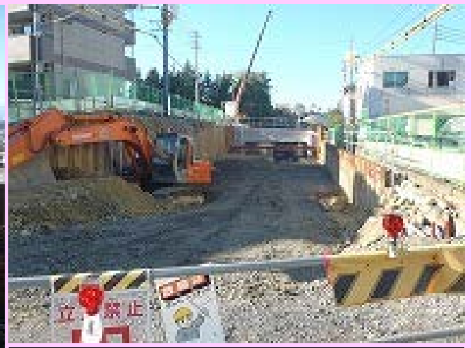
② 立体交差の施工状況