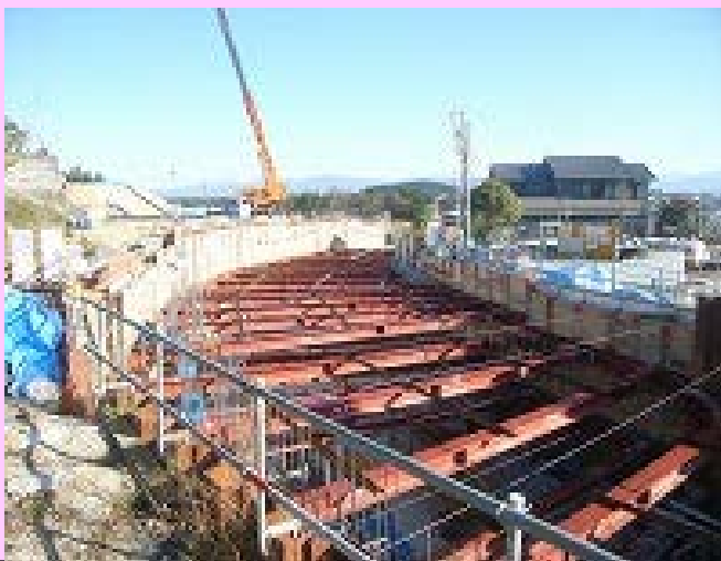
① 立体交差の施工状況