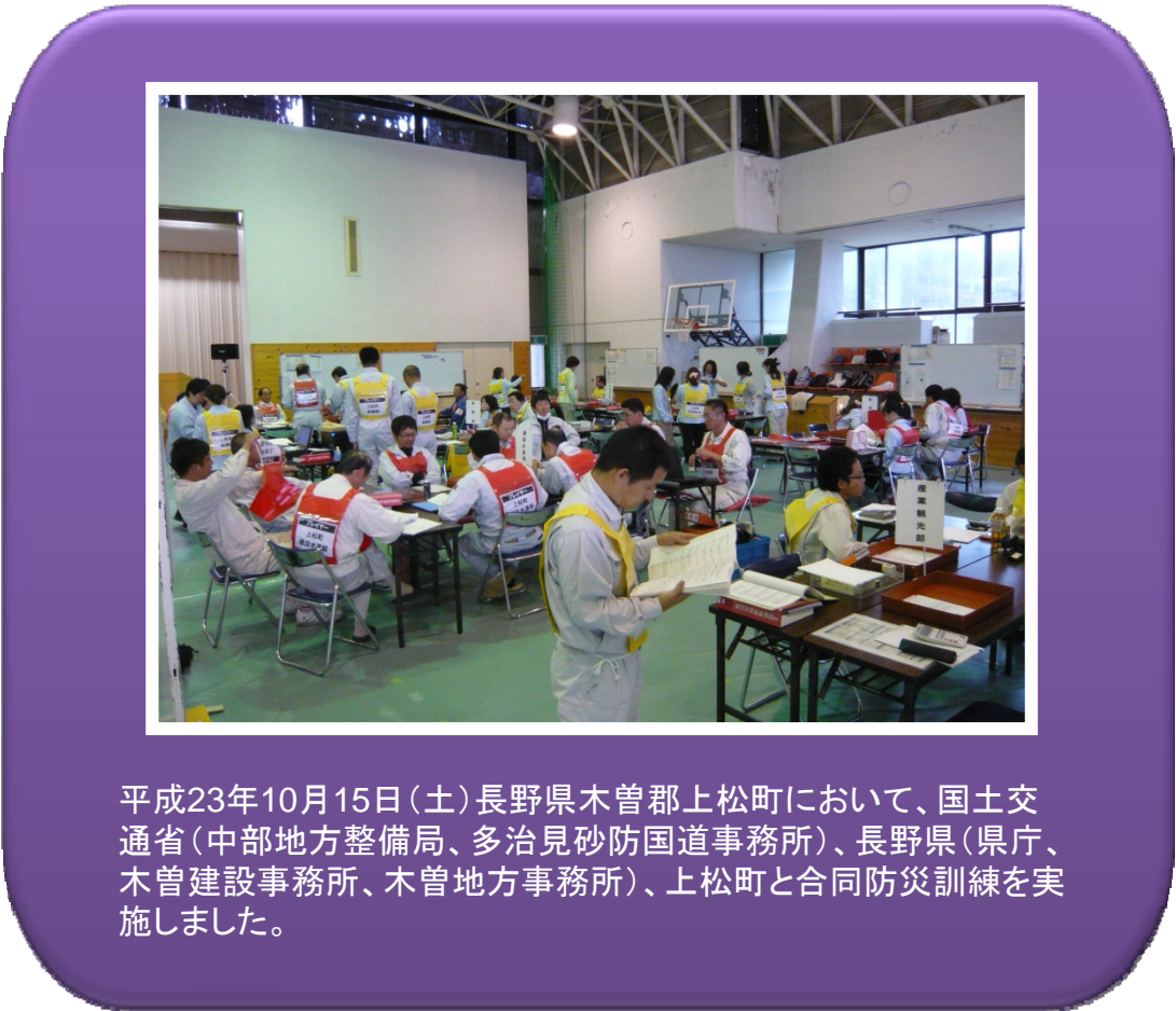
平成23年10月15日(土)長野県木曾郡上松町において、国土交通省(中部地方整備局、多治見砂防国道事務所)、長野県(県庁、木曾建設事務所、木曾地方事務所)、上松町と合同防災訓練を実施しました。