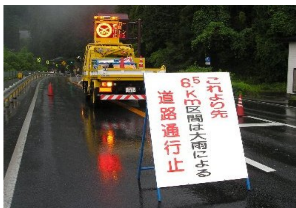
(全面通行止を実施中)