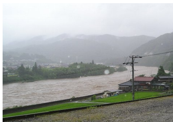
(水位が上昇した木曾川)