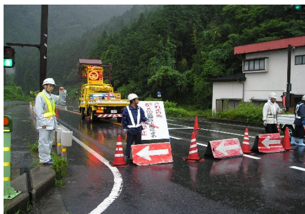
(国道19号 弥栄橋交差点)