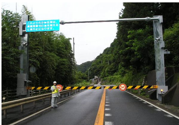
(H18. 7. 19 中津川市山口 黍生ゲート)