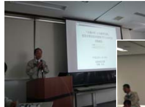
講義を聞く参加者