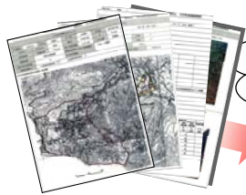
土石流危険渓流カルテ