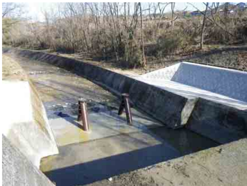
流木捕捉前 （平成23年3月末撮影）