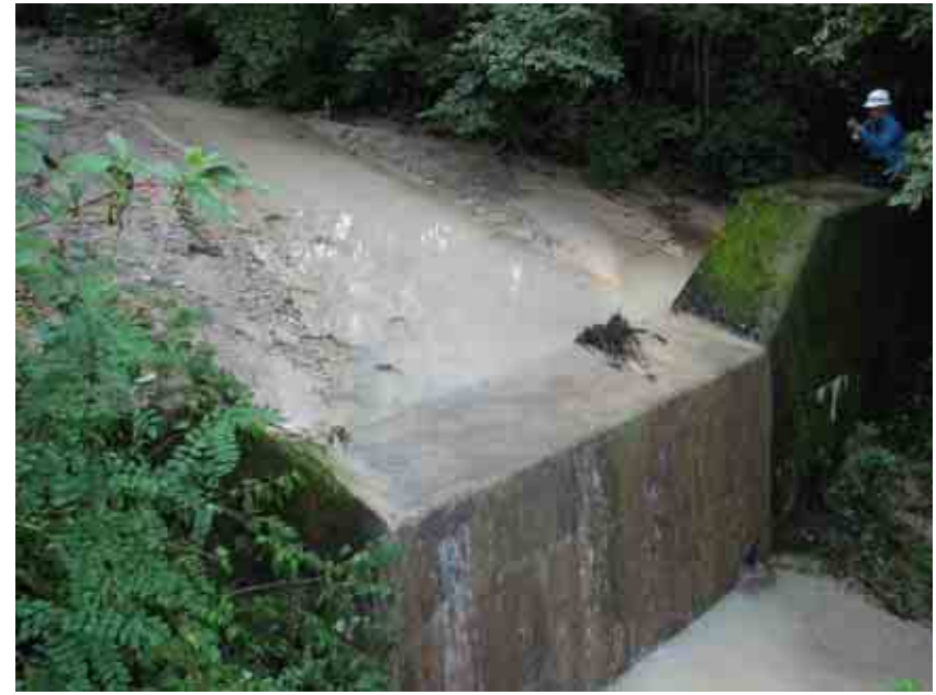
約400m 3 の土砂を補足