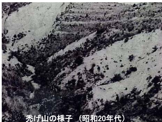
禿げ山の様子 (昭和20年代)