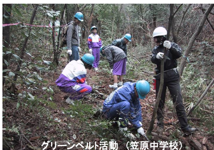
グリーンベルト活動 (笠原中学校)