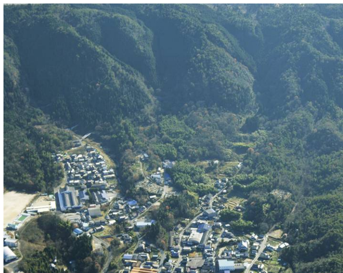
山際まで迫る市街地(笠原川流域)