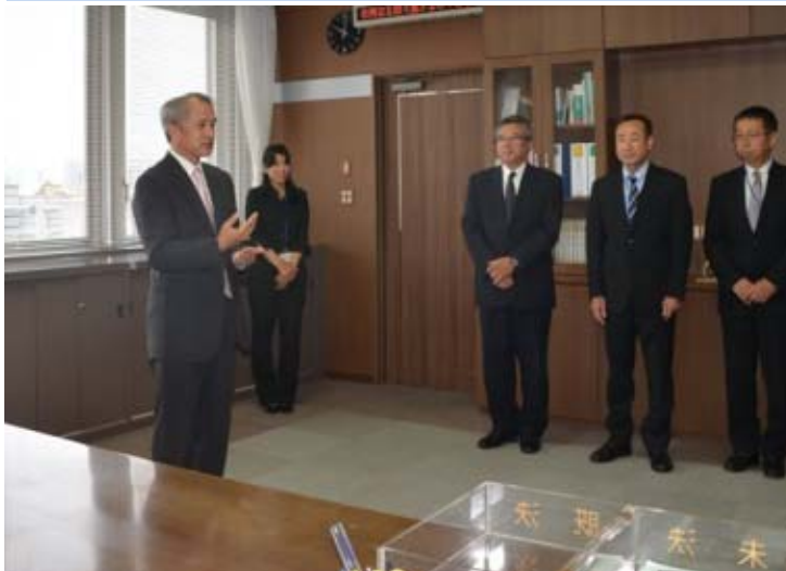
事務所長から祝辞