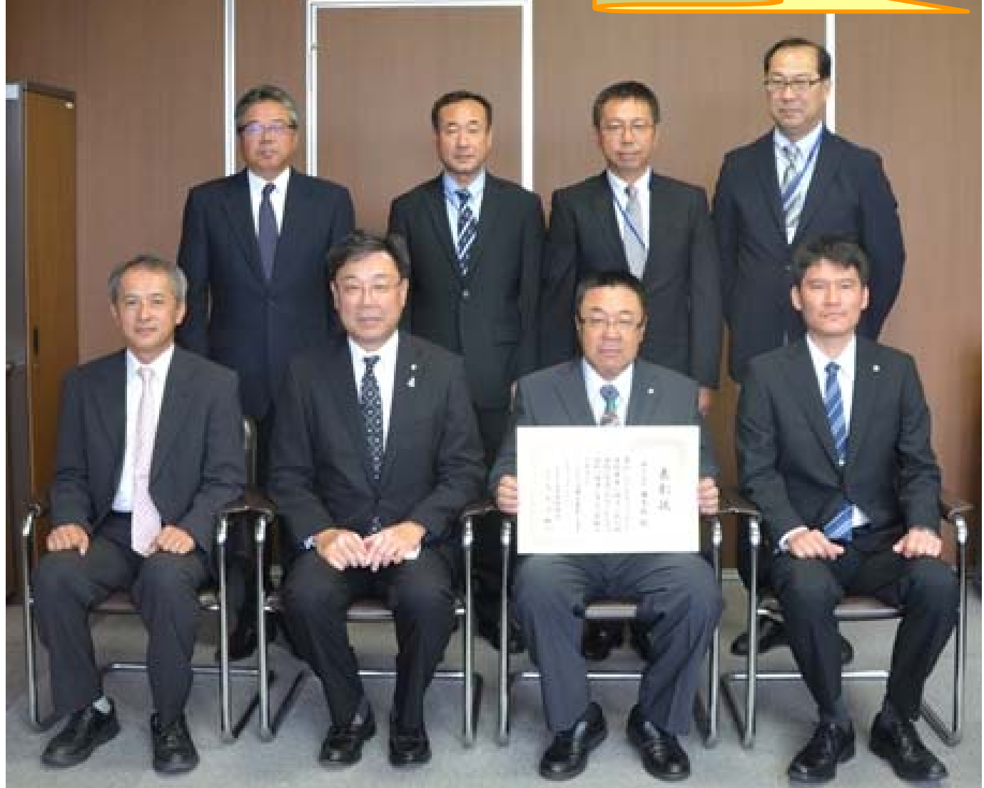
受賞者：株式会社 藤本組さん