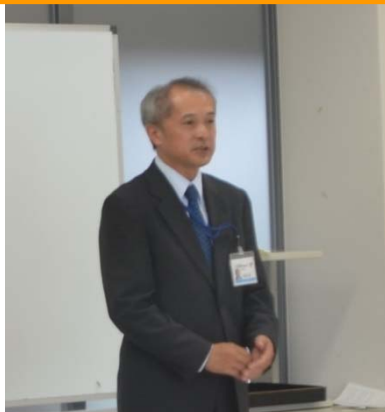
事務所長から祝辞