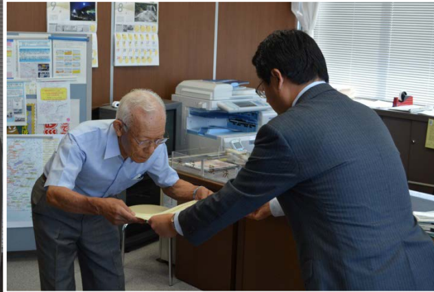
事務所長室での表彰