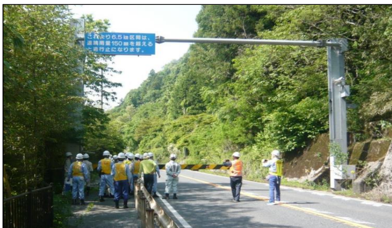
遮断機は車道の両側についており、ゲートを下ろし通行規制訓練（一時通行止め）を行います。