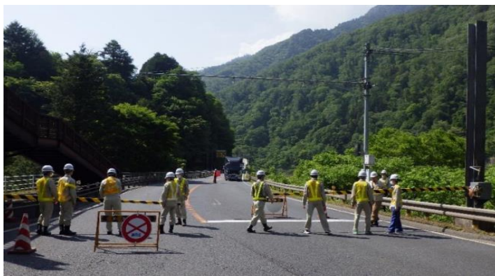
遮断機は車道の両側についており、ゲートを下ろし通行規制訓練（一時通行止め）を行います。