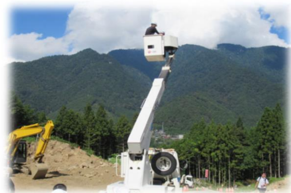
建設機械乗車体験