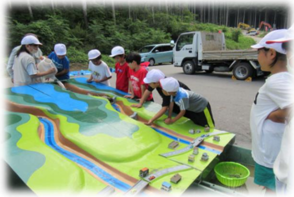
土石流模型実験（砂防施設の効果を学習）