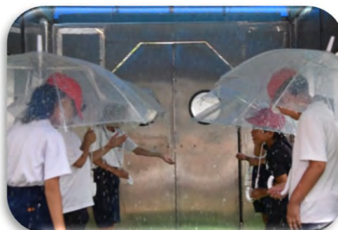
降雨体験(20mm、50mm、120mmの雨を体験)