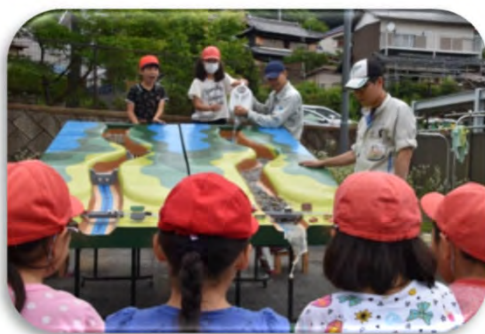
土石流模型実験 (砂防施設の効果を学習)