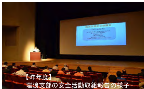
【昨年度】 瑞浪支部の安全活動取組報告の様子