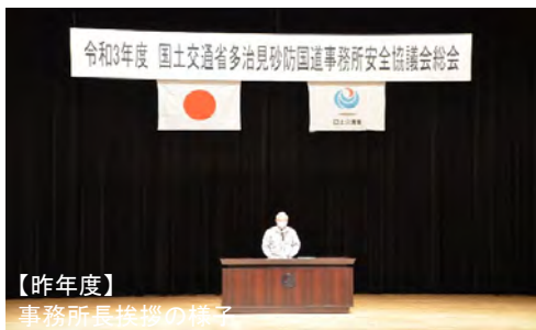
【昨年度】 事務所長挨拶の様子