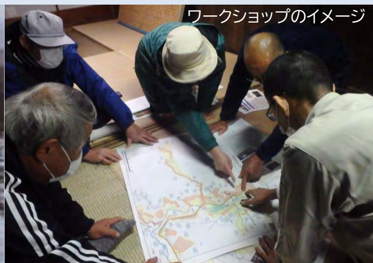
ワークショップのイメージ