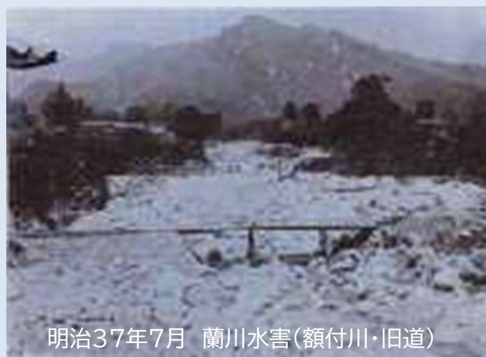
明治37年7月 蘭川水害(額付川・旧道)