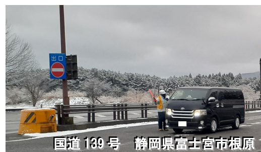
国道139号 静岡県富士宮市根原