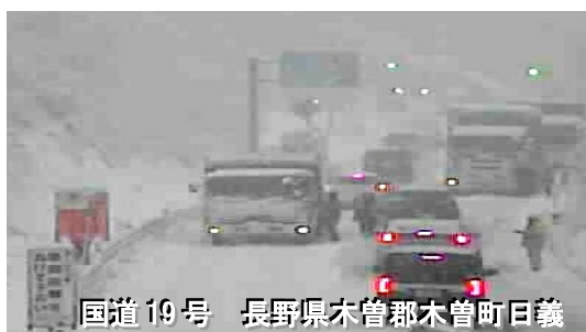
国道19号 長野県木曾郡木曾町日義