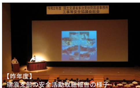
【昨年度】 瑞浪支部の安全活動取組報告の様子