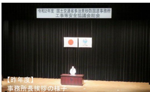
【昨年度】 事務所長挨拶の様子

なお、本総会において、新型コロナウイルス及び流行期となっているインフルエンザの感染拡大防止の為、（別紙-3）を事前にご確認頂きますようお願いいたします。