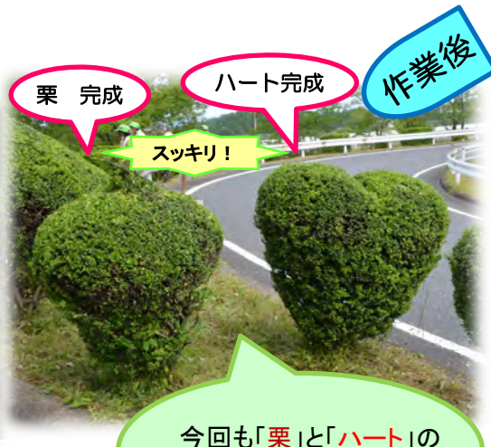
(株)吉川工務店のボランティア参加者からひと言

年2回の道路美化活動も今年で18年目となりました。 日頃から利用しています国道19号線に感謝の意味も含め、 草刈り・剪定・ゴミ拾いを実施しております。作業中に通行する方々からの「ご苦労様」 の一声や、作業終了時の達成感は何物にも代え難いものがあります。今後も道路を利用 する全ての方々が気持ちよく通行できるよう、この活動を継続してまいります。