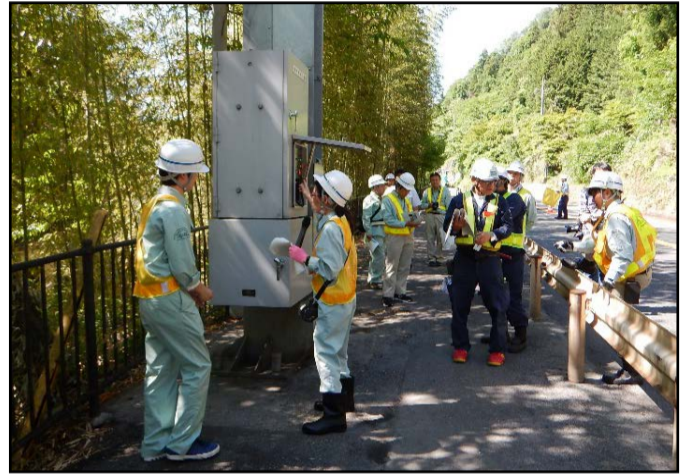
昨年の遮断機操作の訓練の様子