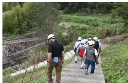
地域づくり活動現場「東濃西部会多治見分会」生田川にて