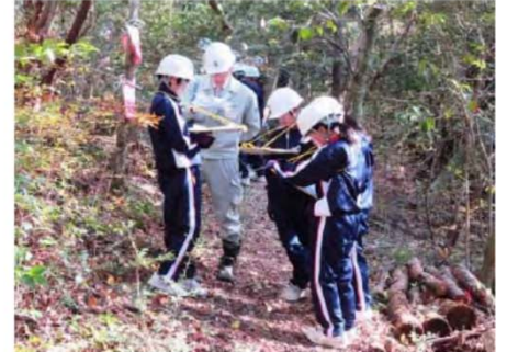
…活動前の安全確認…