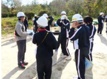
…ヘルメットの装着確認…