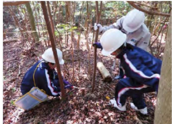
………除伐作業の様子(切った木はきれいに切りそろえました)………