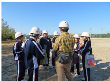
…活動の目的と安全・ヘルメットの装着などの確認……………