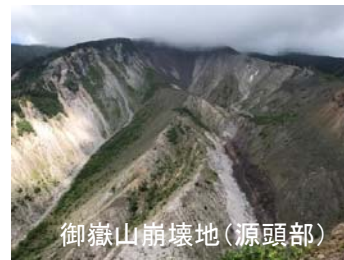
御嶽山崩壊地（源頭部）