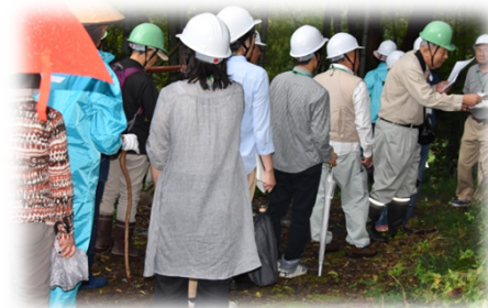
地域づくり活動現場「東濃西部会可茂分会」