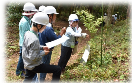
地域づくり活動現場「小里川ダム里山教室」