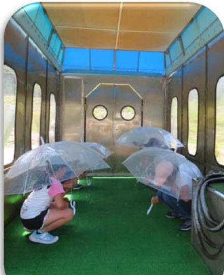
20mm,50mm,120mmの 雨を体験しました