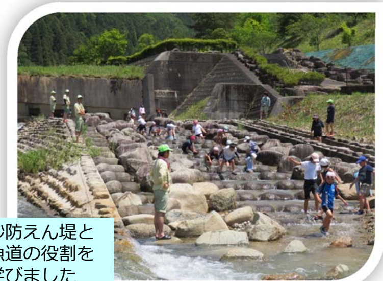
砂防えん堤と 魚道の役割を 学びました