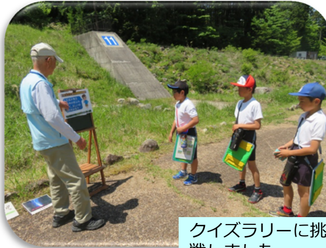
クイズラリーに挑 戦しました