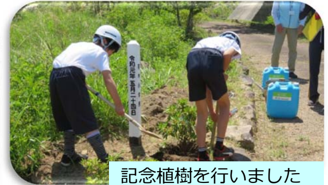
記念植樹を行いました