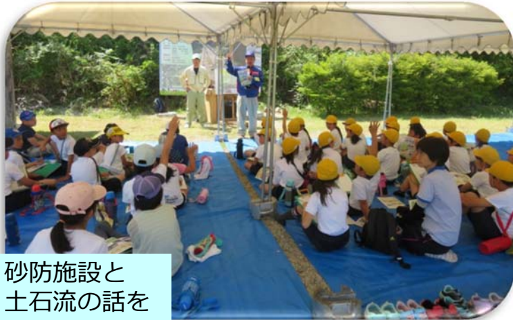
砂防施設と 土石流の話を 聞きました

★令和元年5月24日（金）中津川市立 福岡小学校・阿木小学校4年生のみなさんに『あおぞら教室』を開催しました。