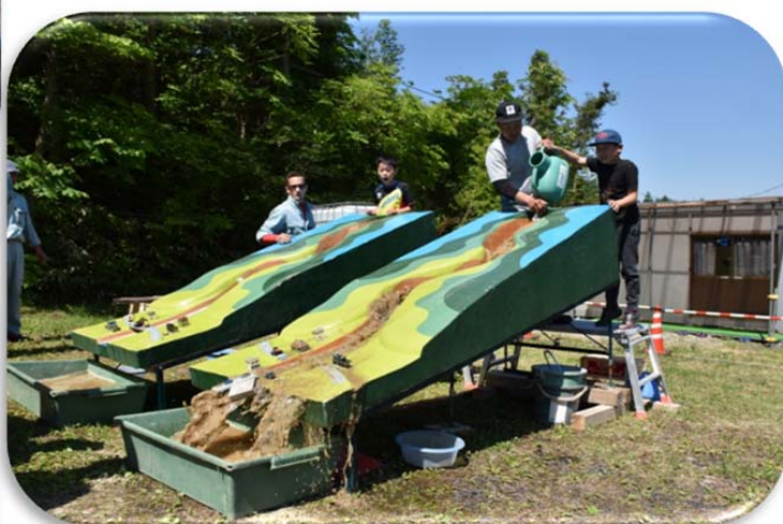
土石流模型実験（砂防施設の効果を学習）