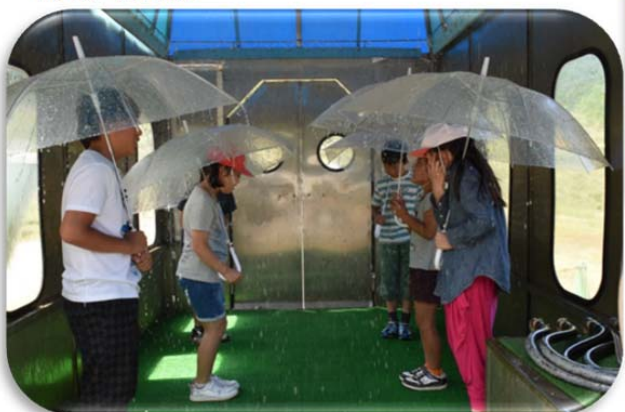
降雨体験機（20mm、50mm、120mmの雨の体験）