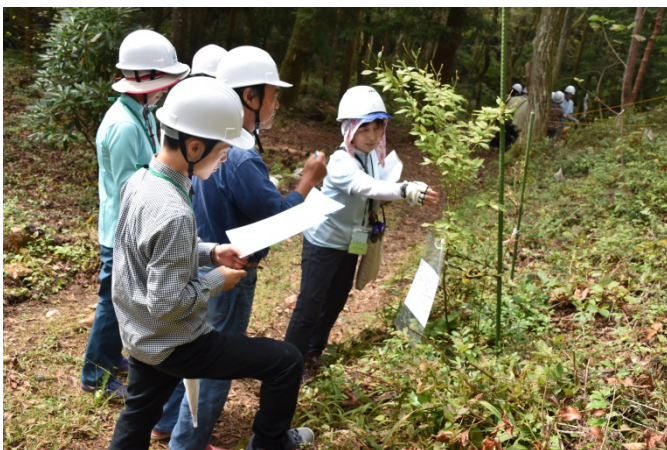
講座修了生でつくる「地域づくり活動」現場見学