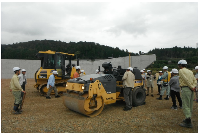
道路工事現場見学(瑞浪恵那道路)