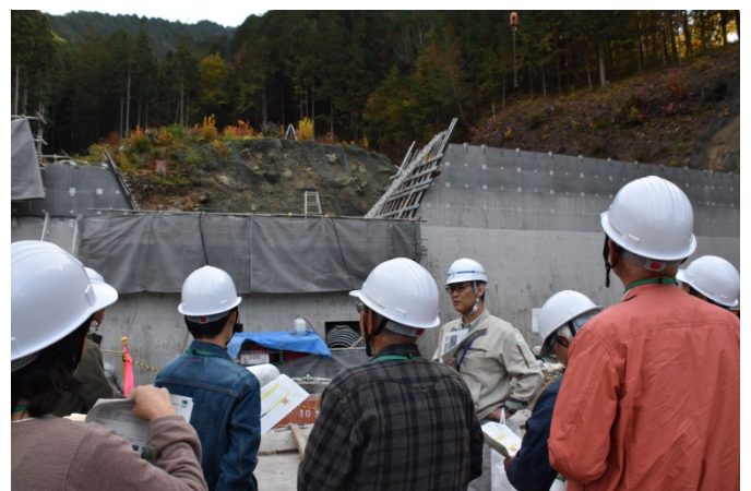
砂防工事現場見学(下在蛇抜沢砂防堰堤)