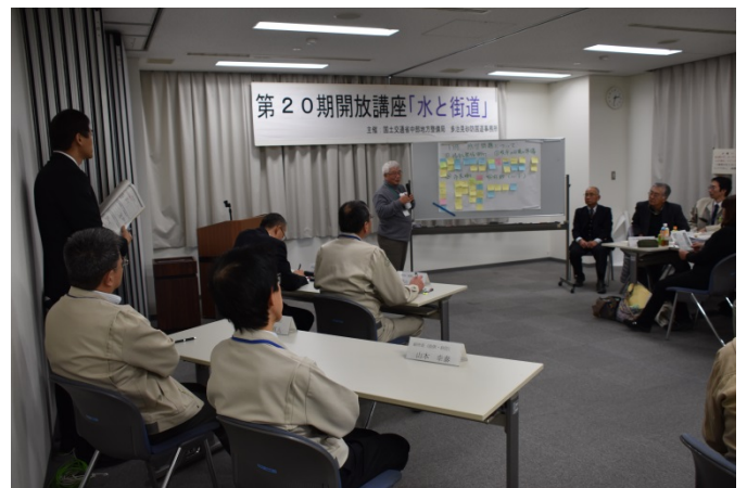
座談会(班単位によるテーマ討論会)