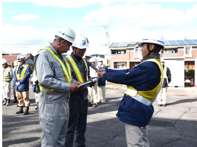
除雪作業請負者、維持作業請負者による安全宣言