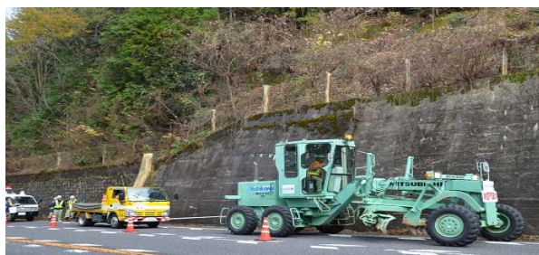
車両移動訓練の様子（中央の黄色のトラックを牽引中）