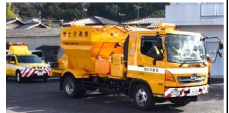
国道19号恵那雪寒倉庫に出発!