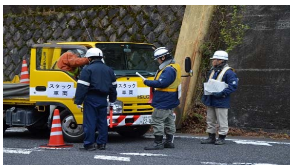
スタック車両の移動命令