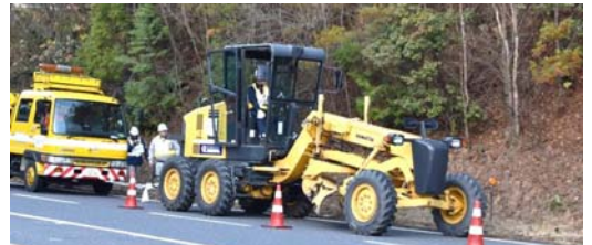
国道21号スタック車両移動訓練