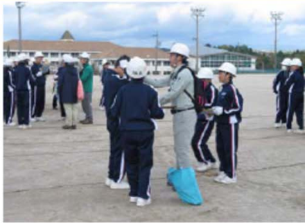
…ヘルメットの装着確認…