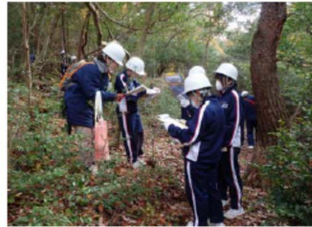
…活動前の安全確認…