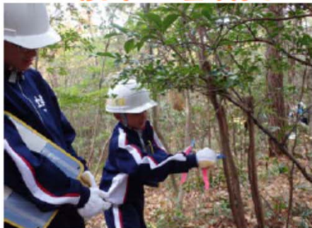
…切る木への目印付け…