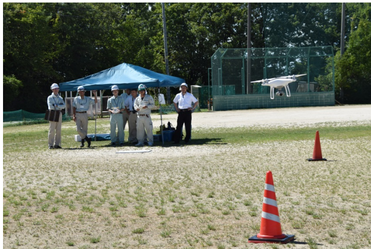
受講生による飛行訓練風景②