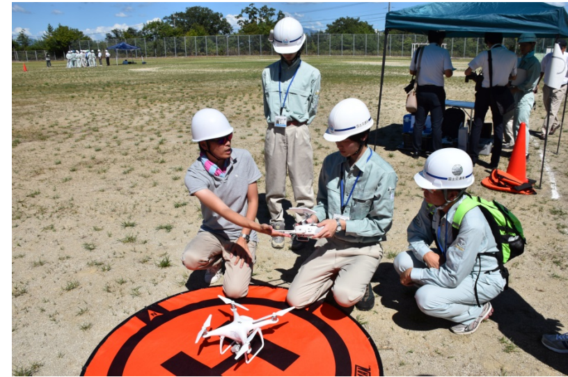
受講生による飛行訓練風景①