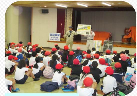
砂防堰堤の役割を 学びました