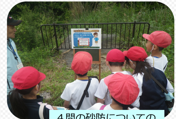
4問の砂防についての クイズに挑戦しました