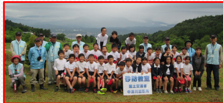
西小学校4年生の皆さん