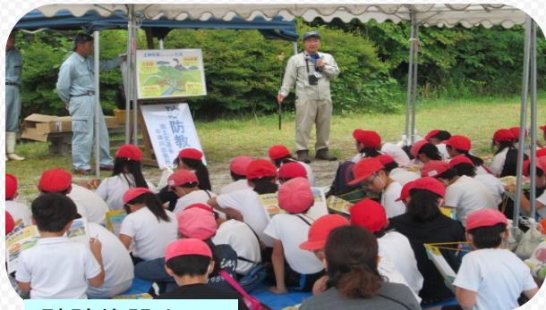
砂防施設と 土石流の話を 聞きました

★平成30年5月31日（木）中津川市立西小学校4年生のみなさんに『あおぞら教室』を開催しました。