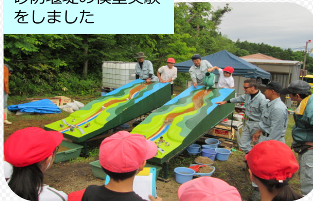
砂防堰堤の模型実験 をしました