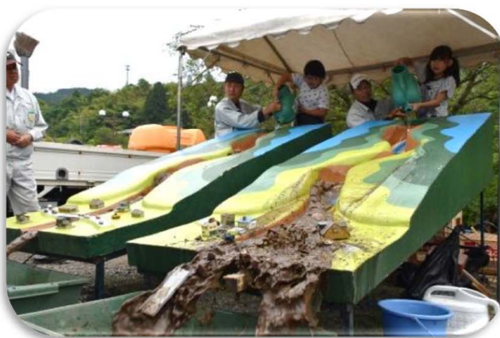
土石流模型実験（砂防施設の効果进行学习）