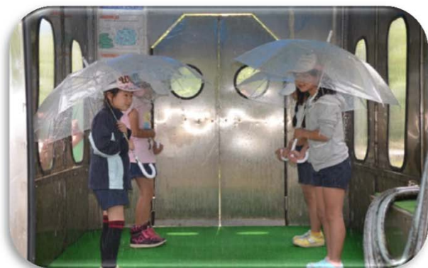
降雨体験機（20mm、50mm、120mmの雨の体験）