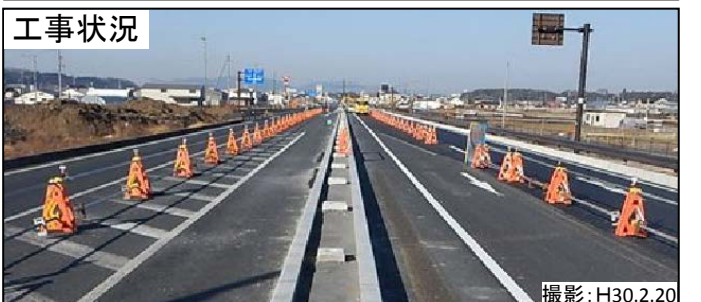
柿田交差点付近 現地状況