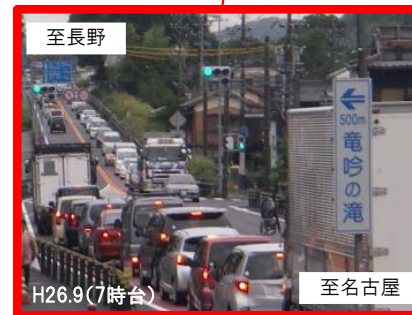
国道19号釜戸町交差点混雑状況