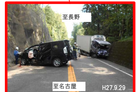
国道19号正面衝突事故状況