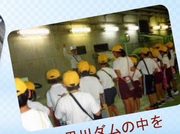
小里川ダムの中を見学しました