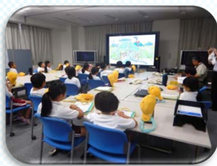
過去に起きた土砂災害などの映像を観ました