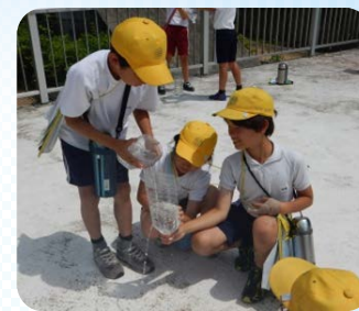
ペットボトルを使ってダムのお働きに関する実験をしました