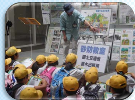
土砂災害や砂防についての話を聞きました

平成29年6月22日（木）、笠原小学校4年生のみなさんに砂防教室を開催しました。