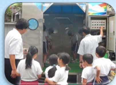
降雨体験機で20mm, 50mm, 120mmの豪雨を体験しました