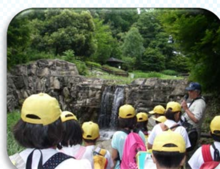
雲五川床固工（土岐市：陶史の森）で床固や砂防えん堤を見学しました