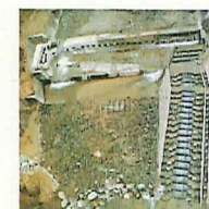
環境に配慮した魚道