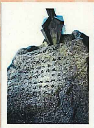
蛇抜けの碑 (じゃぬけのひ) (木曾郡南木曾町)