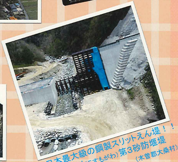
日本最大級の鋼製スリットえん堤！！ 越百川(こすもがわ)第3砂防堰堤 (木曾郡大桑村)