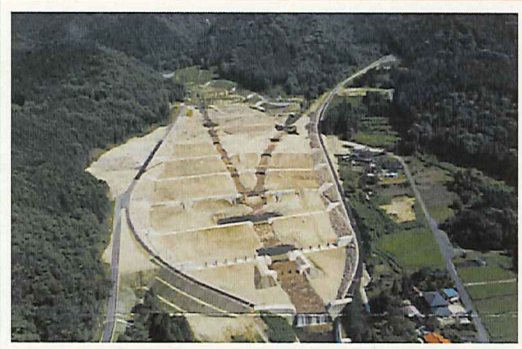
四ツ目川遊砂工 (よつめがわゆうさこう) (中津川市松田)

♪参加された方にはもちろん多治見砂防国道事務所80周年記念「SABOカード」を6枚1セットを無料で差し上げます。