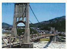
桃介橋(ももすけばし) (木曾郡南木曾町)