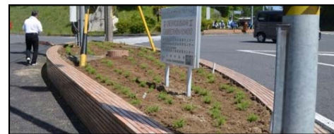
6/9 芝桜の苗が植まりました