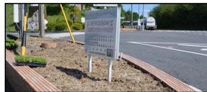
6/1 除草と土作り作業完了