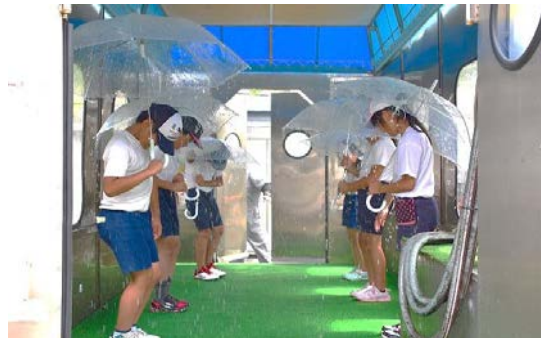
降雨体験(20mm、50mm、120mm の雨を体験)