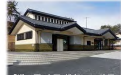
「道の駅」志野・織部トイレ建屋