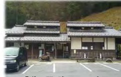
「道の駅」賤母トイレ建屋