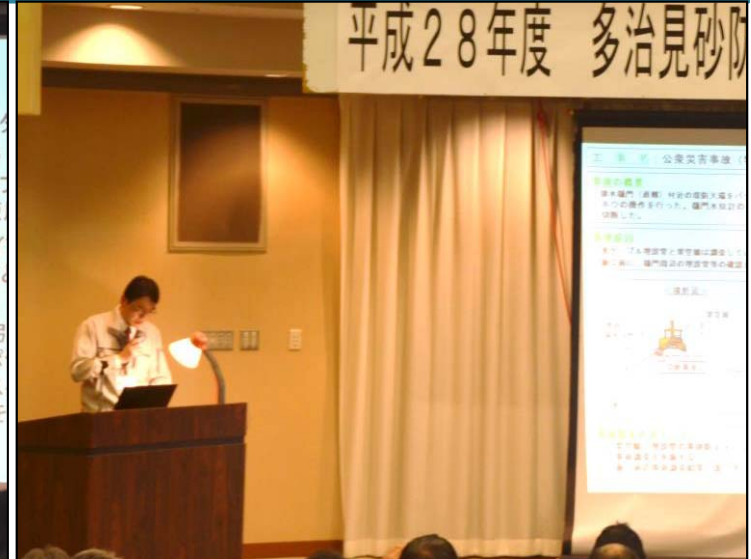
整備局管内の事故等の報告(事務所副所長)