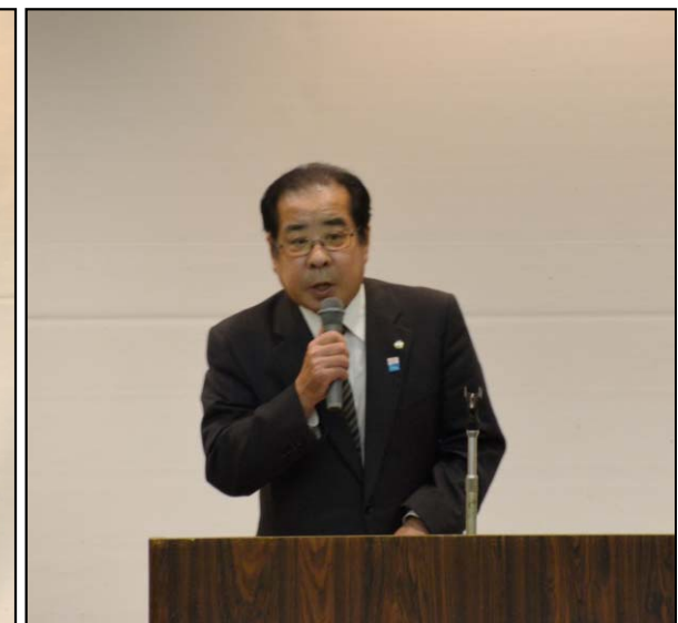
閉会挨拶((株)鳴海組)