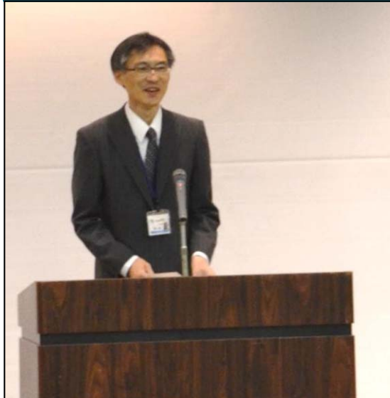
開会挨拶(道事務所長)

当日は120名を超える参加者があり、多治見労働基準監督署より講師を招いて、労働災害防止対策についての講演をしていただきました。また、工事を施工する地域ごとの安全協議会4支部の安全対策への取組報告がありました。