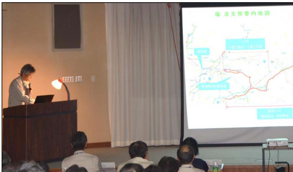
各支部からの活動報告(写真は瑞浪支部)