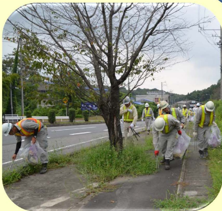
昨年度の清掃活動の様子