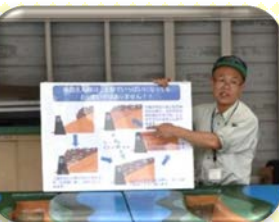
土石流模型実験で砂防堰堤の役割を学びました