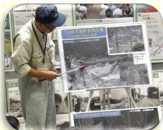
砂防施設のお話し、土石流の話を行いました