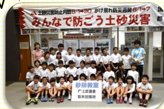
小泉小学校4年3組のみなさん