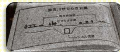
雲五川床固工群【陶史の森】でトンネル水路や床固工を見学しました