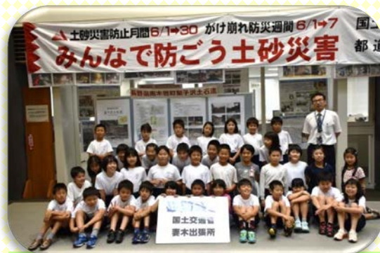
小泉小学校4年2組のみなさん