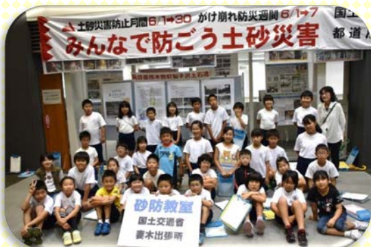
小泉小学校4年1組のみなさん