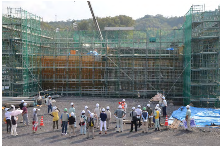
国道21号坂祝バイパス工事現場(カルバート工の施工中)