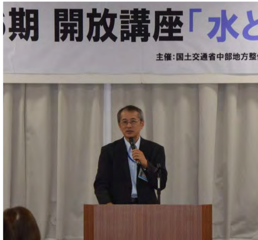
開講式での事務所長挨拶

平成26年9月11日(木)、今年度講座の第1回が開催されました。講座は、東濃地方に在住の方からの一般申し込みにより、本日は18名の方が参加されました。道路講座の受講、坂祝バイパス工事現場・可児市のボランティア団体活動の見学を行いました。