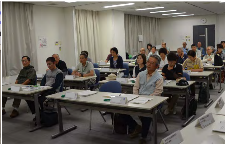
開講式会場の様子