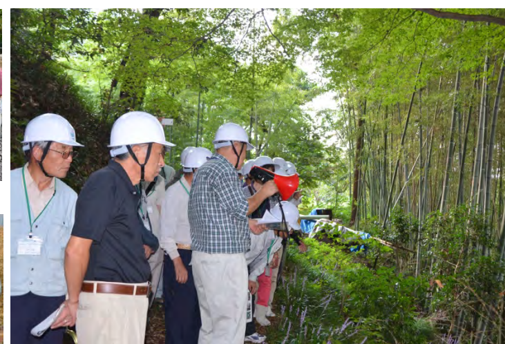
「水と街道東濃西部会加茂分科会」の歩道整備を見学(可児川にて)