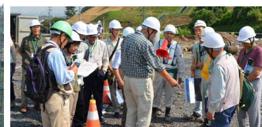
地質について熱心に質問する参加者