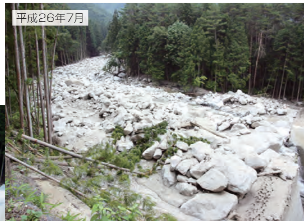
土石流をしっかりと受け止めたところ