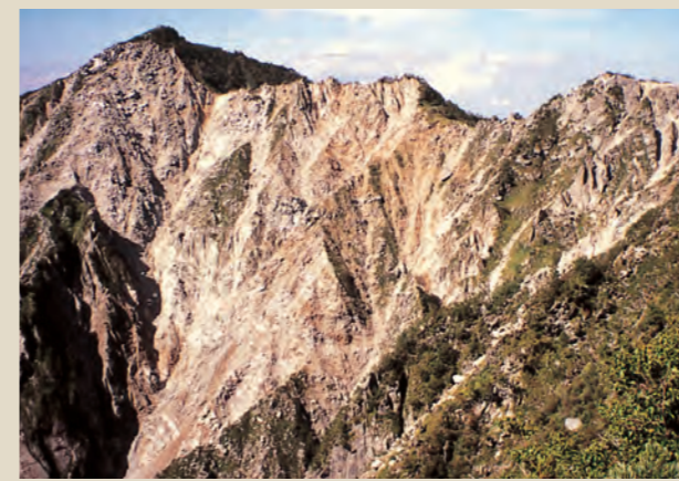
滑川上流の山がくずれているようす