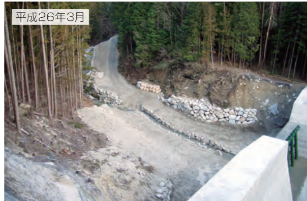
梨子沢第2砂防堰堤 (南木曾町)

土石流をしっかりと受けとめ、その勢いを弱めて下流に流します。そして、土石を貯めて山の斜面がくずれないようにし、下流にある私たちの命や財産を守ります。