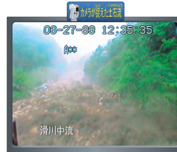
カメラが捉えた土石流の動画を見ることができます。

http://www.cbr.mlit.go.jp/tajimi/sabo/mov/camera_rec.html