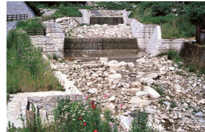
額付床固工群 (南木曾町)