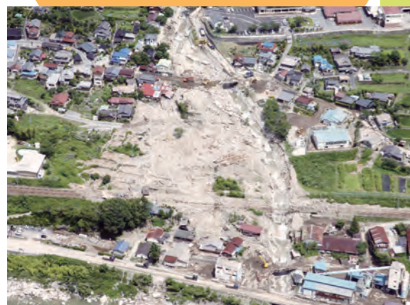
平成26年7月 南木曾町豪雨災害 (長野県南木曾町)

谷や山の斜面からくずれた土や石などが、大雨による水といっしょになって、一気に流れ出てくることをいいます。