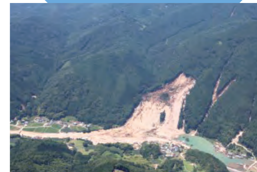
平成29年7月 九州北部豪雨 (大分県日田市)

ゆるやかな斜面で、ねんどのようなすべりやすい地層に雨水がしみこみ、それで地面がズレてゆくことです。