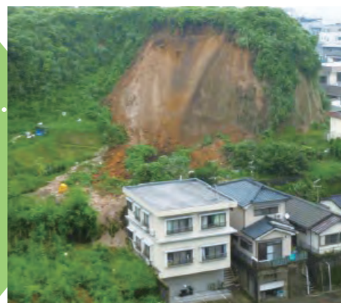
平成27年6月 梅雨前線豪雨 (鹿児島県鹿児島市)

急な斜面の地面の中に雨がしみこみ、突然くずれ落ちることをいいます。地震で起きることもあります。