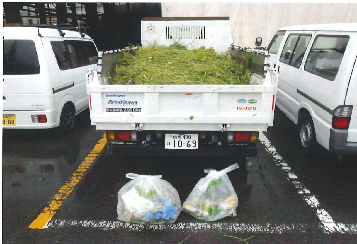
中津川市環境センターにて処理