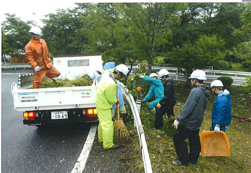
除草積み込み作業