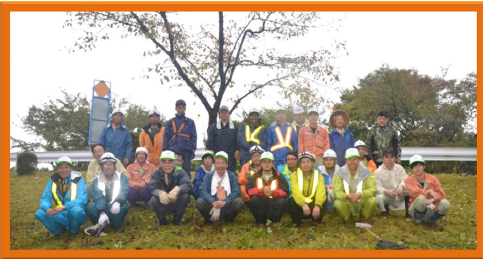
雨の中お疲れ様でした

【低木をハートと栗の形に刈込み】 ゴミはゴミを呼びます。手入れの行き届いた場所にはゴミは捨てられにくいものです。今回の活動で、当事務所から「ハート」と「栗」の形に刈り込んでもらえないかと提案し、できあがった物がこちらです。ゴミのポイ捨て防止対策として期待しています。