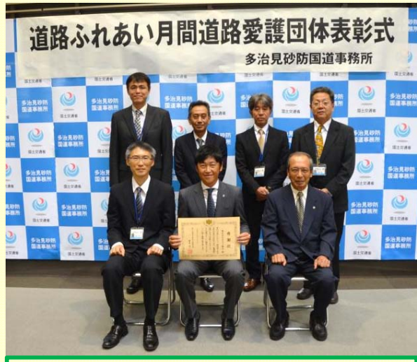
平成29年度中部地方整備局長表彰を受賞されました。