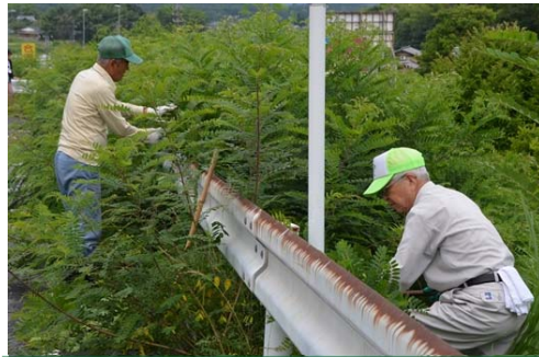
背丈ほどある草を刈り取っていきます。

当日は、比較的涼しい日ではありましたが、皆さん汗だくで、背丈よりも高いような草を端から刈り取っていくと、「しでこぶし」の木が出てきました。国道から見る景観もまるで様変わりし、スッキリしました。