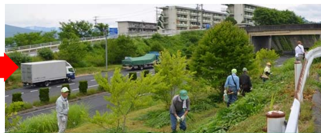
しでこぶしもあらわに