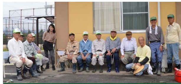
全員集合！お疲れ様でした。