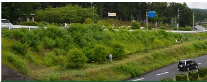
すっきりしました。