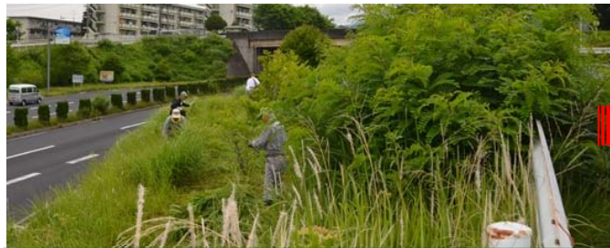
作業中、ひたすら刈り込んでいくと・・・