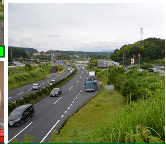
19号下り側も会所ヶ丘区皆さんの作業です